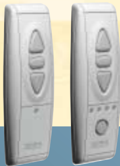
Funk-Handsender Telis 1 RTS/Telis 4 RTS

Und wenn sich der Endverwender die Sache mal anders überlegt, zusätzlich Sender einlernen oder das System erweitern will? Kein Problem! Somfy Technologie ist so flexibel wie die Wünsche Ihrer Kunden.