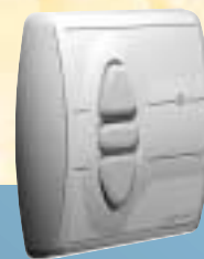
Funk-Wandsender Centralis RTS

– für die vollautomatische Ansteuerung eines/mehrerer Rollläden