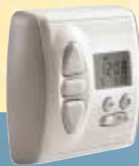
Funk-Programmschaltuhr Chronis RTS

– für die Ansteuerung eines/mehrerer Rollläden